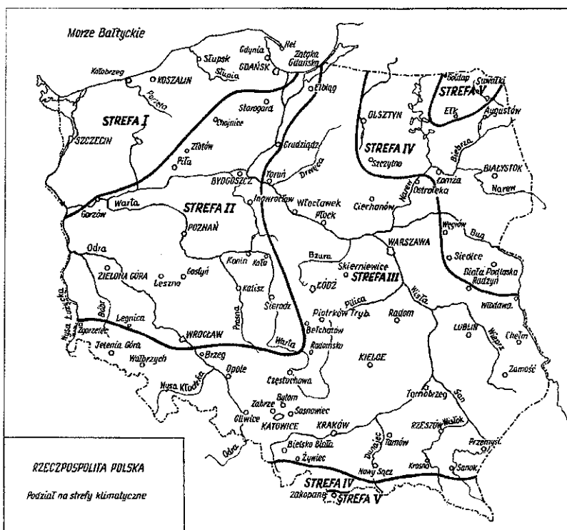
Rys.1 Podział Polski na strefy klimatyczne (Załącznik krajowy NB do PN-EN 12831)